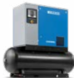
Versione montata su serbatoio con essiccatore integrato