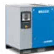
Versione montata a pavimento