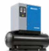
Versione montata su serbatoio